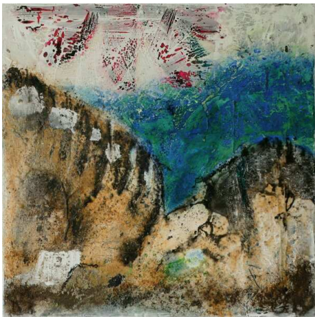
Bild 28, Bucht, 50 x 50 Mischtechnik