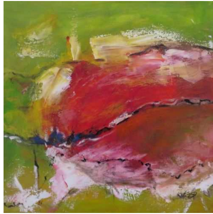
Bild 38, Neues Leben, 40 x 40 Acryl auf Leinwand