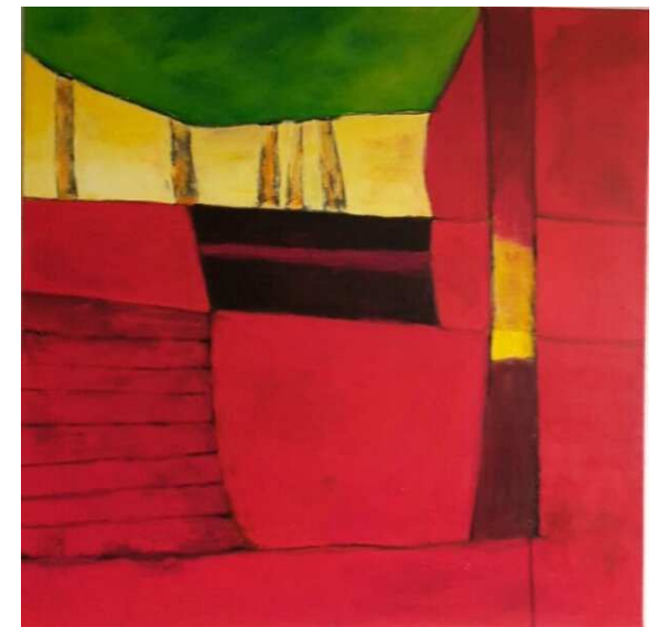
Bild 14, Landschaft in Rot III, 80 x 80 Acryl auf Leinwand