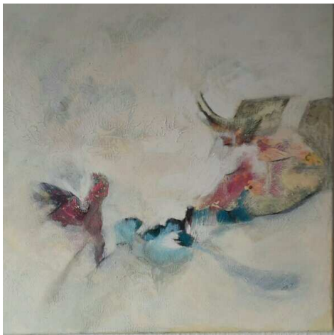
Bild 22, Lass der Seele Flügel wachsen 50 x 50 , Acryl auf Leinwand