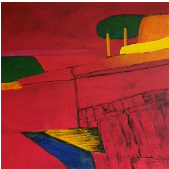
Bild 12, Landschaft in Rot I, 80 x 80 Acryl auf Leinwand