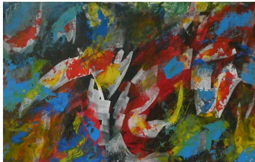
Bild 35, Schnabel, 63 x 93 Acryl auf Leinwand