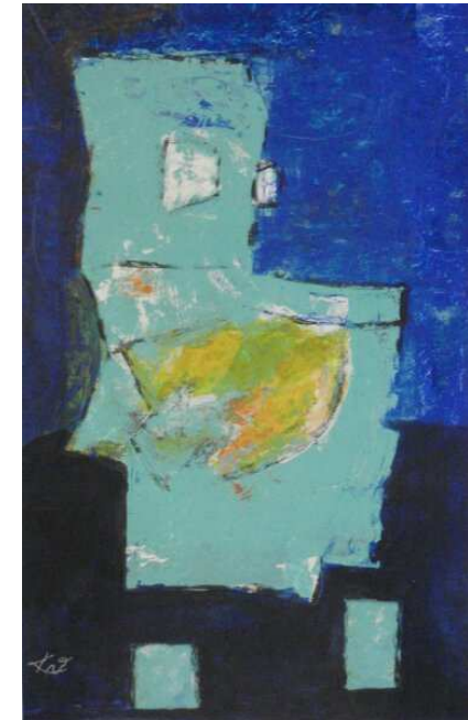
Bild 19, Sitzmöbel, 63 x 93 Acryl auf Leinwand