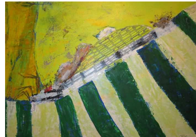
Bild 24, Aufwärts, 70 x 50 Mischtechnik