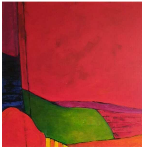
Bild 13, Landschaft in Rot II, 80 x 80 Acryl auf Leinwand