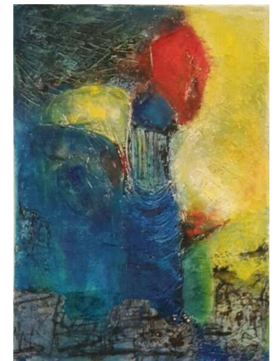
Bild 3, Tiefes Blau, 50 x 70 Mischtechnik