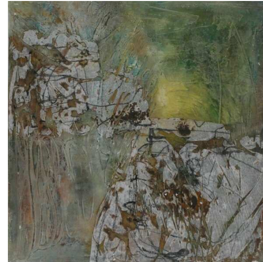
Bild 27, Am Riff, 60 x 60 Schlämmkreide