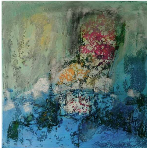
Bild 4, Ballonfahrt, 60 x 60 Mischtechnik