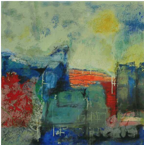
Bild 1, Hongkong, 80 x 80 Mischtechnik