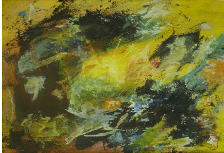
Bild 21, Wildnis, 80 x 60 Acryl auf Leinwand