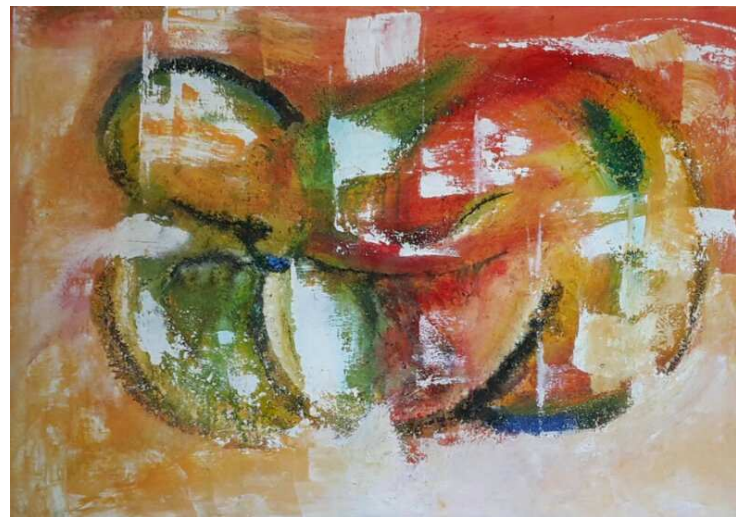
Bild 2, Die Leichtigkeit des Seins anstreben, 70 x 100 Mischtechnik