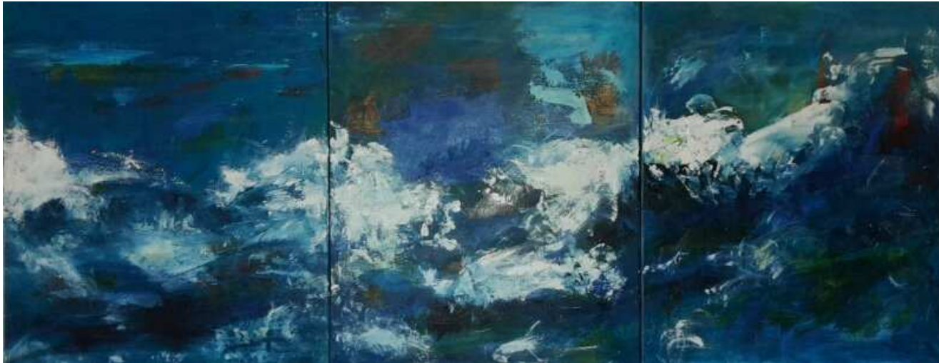
Bild 9-11, Stürmische See, Tryptichon, 150 x 60 Acryl auf Leinwand