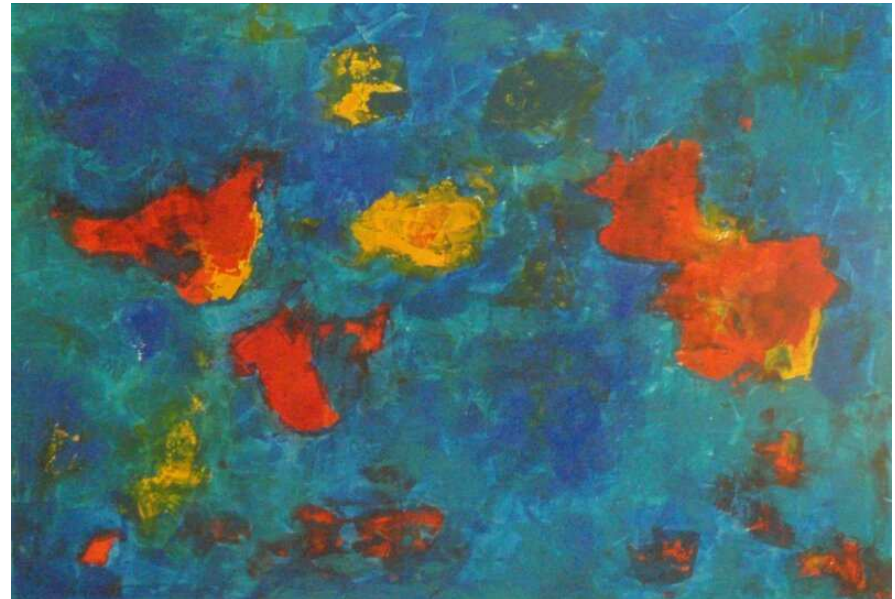
Bild 40, Unter Wasser, 70 x 100 Acryl auf Leinwand