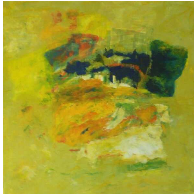
Bild 18, In der Ferne, 100 x 100 Acryl auf Leinwand