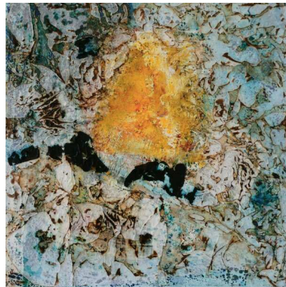
Bild 29, Helles Blau, 40 x 40 Mischtechnik