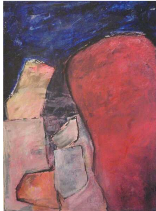
Bild 33, Mystischer Planet, 60 x 80 Acryl auf Leinwand