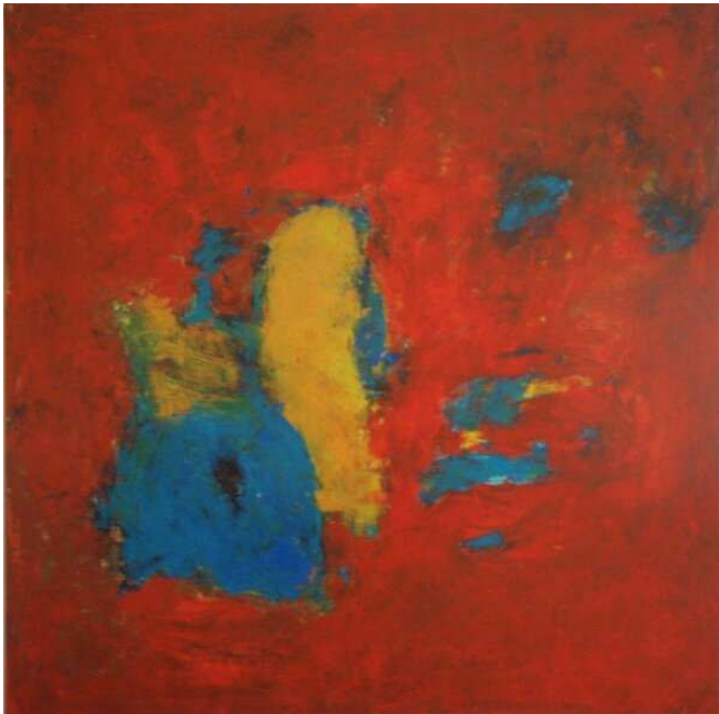
Bild 17, Kraft, 100 x 100 Acryl auf Leinwand