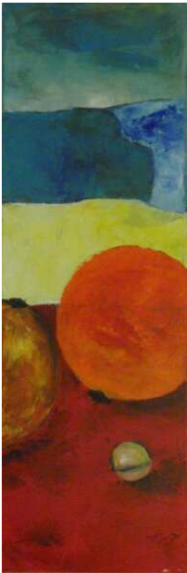
Bild 15, Küchenansicht, 30 x 90 Acryl auf Leinwand