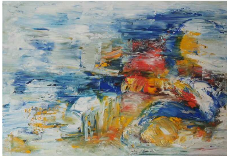
Bild 5, Und ständig ist alles in Bewegung, 70 x 100 Acryl auf Leinwand