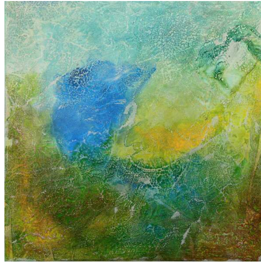
Bild 26, Die Maus, 60 x 60 Acryl auf Leinwand