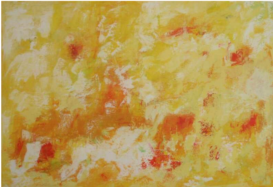
Bild 39, Andalusien, 70 x 100 Acryl auf Leinwand