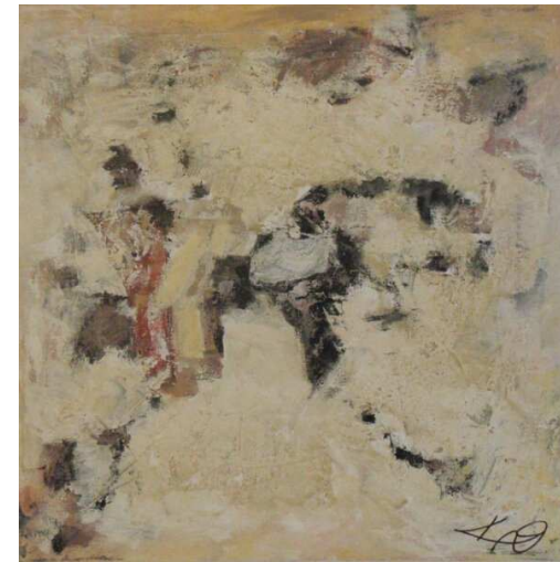
Bild 8, Hund in Siena, 60 x 60 Mischtechnik