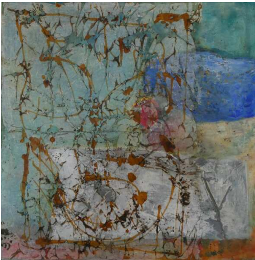
Bild 6, Teetime, 60 x 60 Mischtechnik