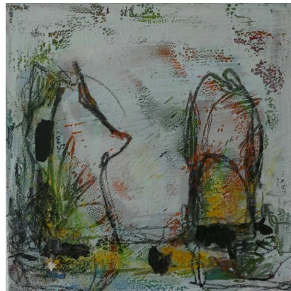
Bild 30, Am Wasser, 40 x 40 Mischtechnik