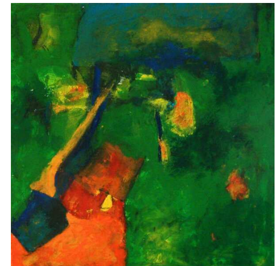
Bild 36, Aussöhnung mit Grün, 60 x 60 Acryl auf Leinwand