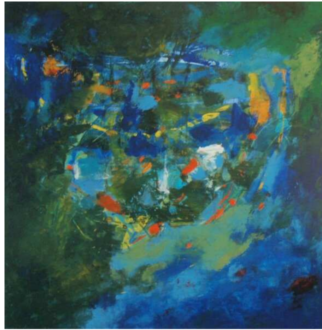
Bild 16, Farbenspiel, 100 x 100 Acryl auf Leinwand