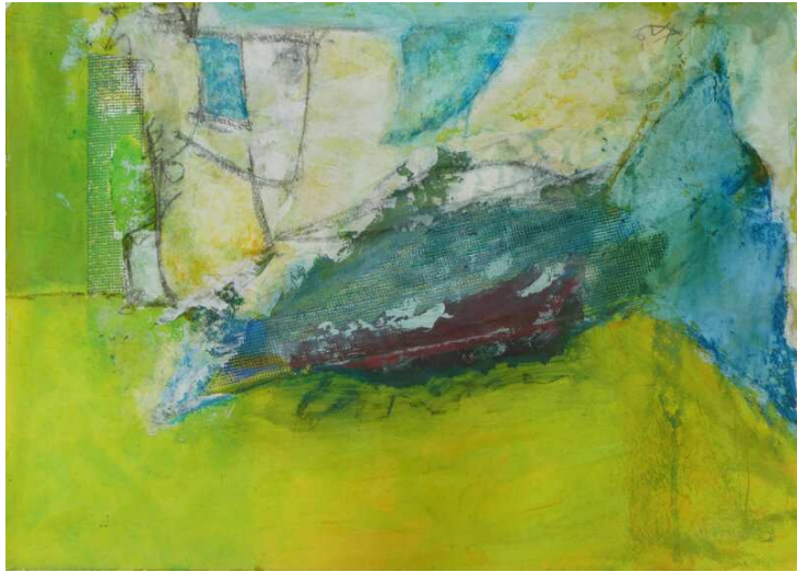
Bild 32, Segelboot, 50 x 70 Acryl auf Leinwand