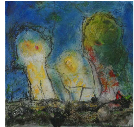
Bild 31, Aufgeschossen, 40 x 40 Mischtechnik