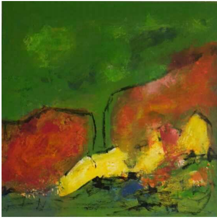
Bild 37, Geteiltes Grün, 40 x 40 Acryl auf Leinwand