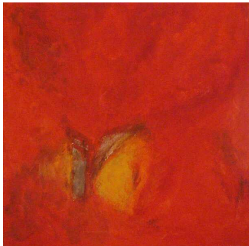
Bild 34, Leben, 50 x 50 Acryl auf Leinwand